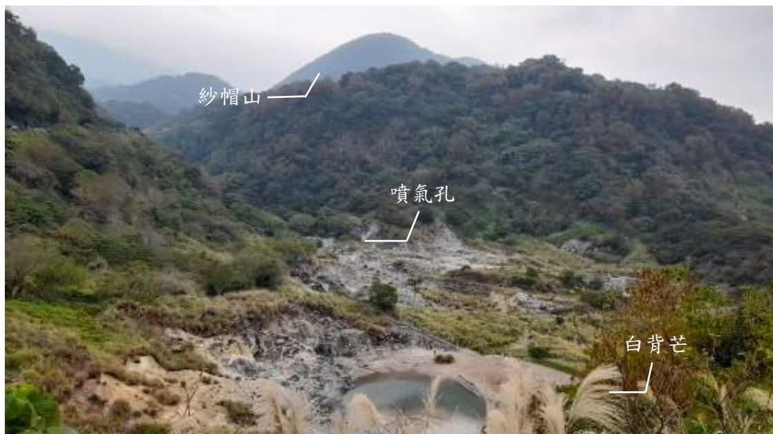
圖 1. 龍鳳谷（自攝，2024/1/29 實地訪查）

每當從石牌上山約 20 分鐘車程到惇敘工商附近，總會聞到一股濃重的硫磺味，從馬路邊向下俯視，映入眼簾便是如圖 1. 的谷地景觀。