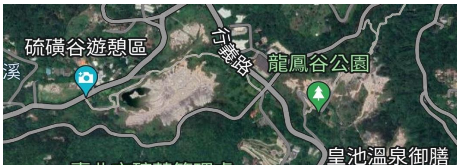
圖 2. 龍鳳谷、硫磺谷相對位置(GoogleMap 衛星影像圖，2024)

陽明山國家公園的龍鳳谷與硫磺谷，舊名大磺嘴，是以泉源路與行義路相交的十字路口所區隔出的兩個谷地（見圖 2.），路邊與谷內常能看到許多白背芒的芒花。除此之外常見的植物還有栗蕨、芒萁、山麻黃等。推測可能因為火山地質，再加上士林北投地區本因大屯山群遮蔽而冬天乾燥少雨，耐乾耐高溫的植物較，合生存。