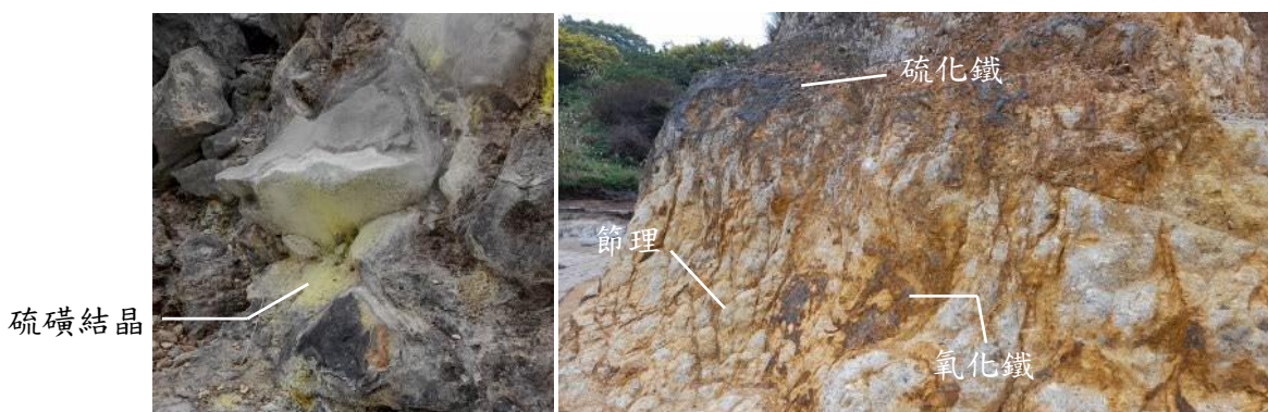
圖 4. 噴氣孔(自攝於龍鳳谷，2024)

圖 5. 攝於硫磺谷，步道旁裸露的砂岩，有著黃、紅棕到黑的色彩組合，質地疏鬆易剝落。仔細看，圖片左下角還有方格狀的節理。經化學風化作用，砂岩中的鐵元素氧化成脆弱的紅棕色氧化鐵，硫氣孔噴出的硫化氫又與氧化鐵反應形成黑色的硫化鐵，因此可觀察到越遠離硫氣孔的砂岩越呈多彩的色澤。