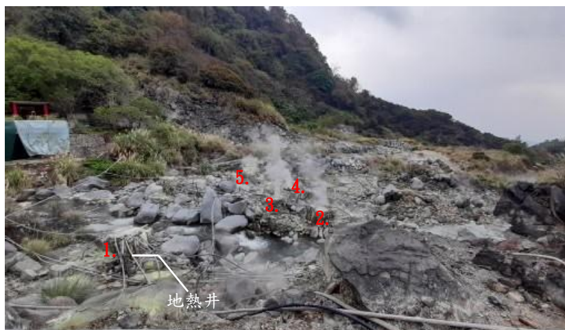
圖 6. 溫泉管線(自攝於龍鳳谷，2024)

的管路。會有這些現象，推測是因為此谷的人造溫泉系統是各商家分別設置，而硫磺谷則是由自來水事業處統一設置。因緣際會下得以訪談當地長者，參考他的說法，60年代至民國68年禁娼是北投溫泉的全盛時期，龍鳳谷的私人管線至當時便已開始架設，一直以來似乎沒有非常受到政府的管制。綜上所述，經親自查訪，龍鳳谷的私人管線已經嚴重遮蓋原地貌，在視覺上破壞了地質景觀，可能影響觀光與地方永續發展。