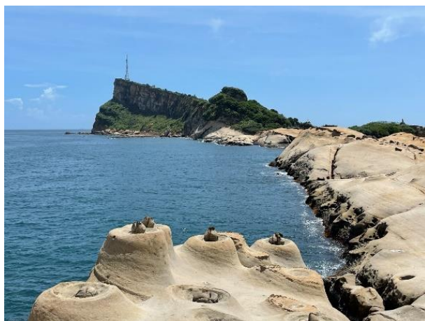
圖 1 台灣地景保育網任選一張地景的照片或自行拍攝或選用照片(請務必註明出處)