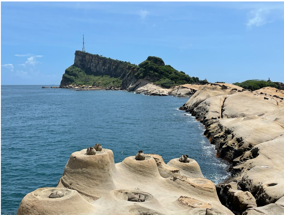
圖 1：台灣地景保育網任選一張地質公園的照片